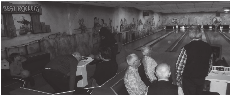
Foto: de bowlingclub, druk bezig het bestuur te verslaan...

Maandag 23 oktober kwam het bestuur van de KBO ook eens enthousiast deelnemen aan dit spel. Het bestuur eindigde met een gemiddelde van 62 punten per deelnemer en bij de leden van de bowlingclub was het gemiddelde 101 punt!