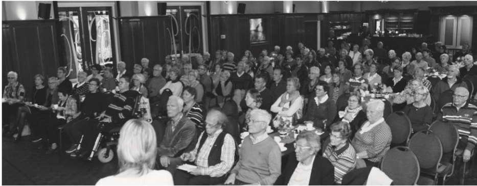
Foto: aandachtig gehoor in de Prinsenhof