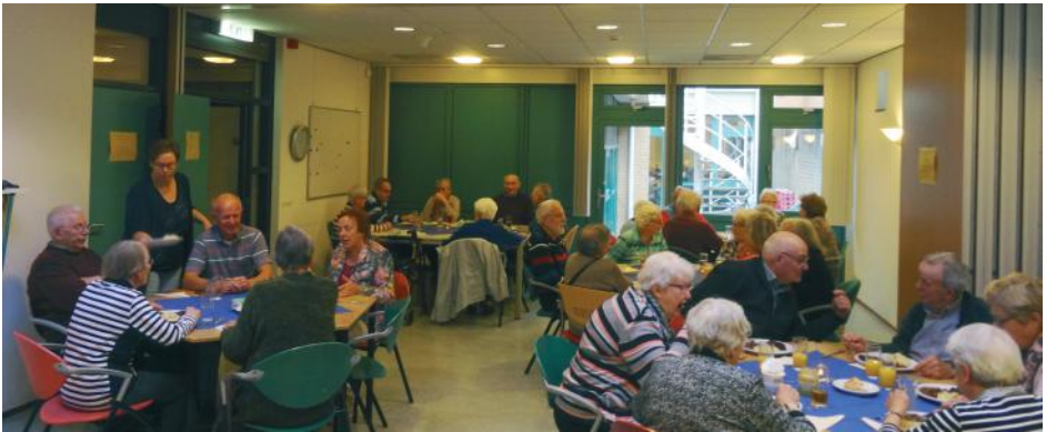
Foto: lekker eten en degelijke praat.