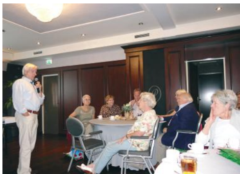
Foto: een aandachtig gehoor.

actueel kunnen informeren over wat de KBO allemaal in huis heeft. Naast onze Nieuwsbrief is onze website immers belangrijke aanvulling om KBO Best goed op de kaart te zetten en onze leden van heldere en goede informatie te voorzien. Een geslaagde avond, afgesloten met een drankje. Vrijwilligers hartelijk dank voor jullie aanwezigheid.